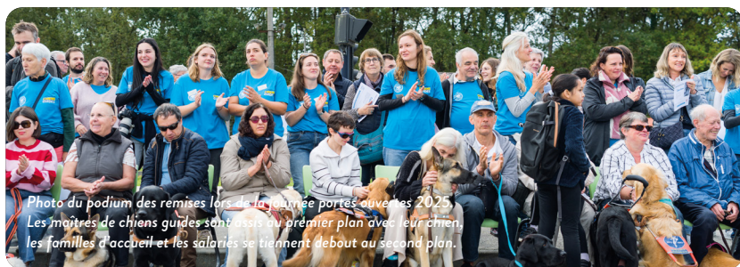
Photo du podium des remises lors de la journée portes ouvertes 2025. Les maîtres de chiens guides sont assis au premier plan avec leur chien, les familles d'accueil et les salariés se tiennent debout au second plan.