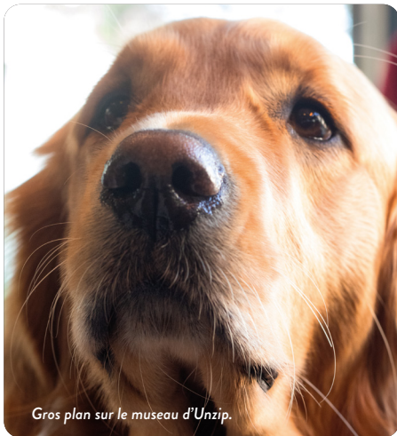
Gros plan sur le museau d'Unzip.